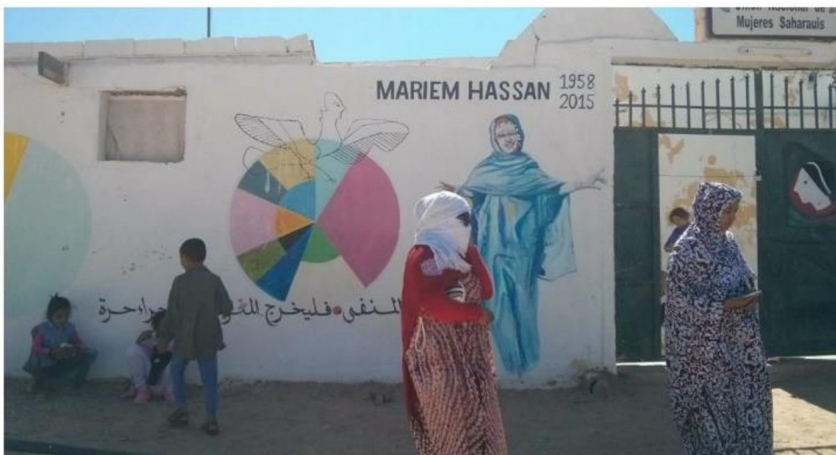
Figura 5. Fachada de la sede de la Unión Nacional de Mujeres Saharaui en la Wilaya Bojador (campamento de personas refugiadas en Tindouf, Argelia). Octubre, 2017

todo un pueblo por el derecho a la autodeterminación y por la conciencia de la importancia de visibilizar la presencia y protagonismo de las mujeres en la sociedad saharauí” (ANARASD).