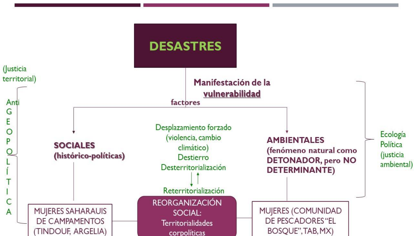
Figura 1. Propuesta teórico metodológica del trabajo de investigación con estudios de caso.

Consideramos la pertinencia de conocer, estudiar, analizar y compartir estos dos casos en espacios académicos para la búsqueda de propuestas y acciones que contribuyan a la impartición de justicias territoriales y ambientales de pueblos y comunidades del Sur Global, que se encuentran muchas veces en el olvido local, nacional, gubernamental e internacional, y en las cuales participan activamente las mujeres.