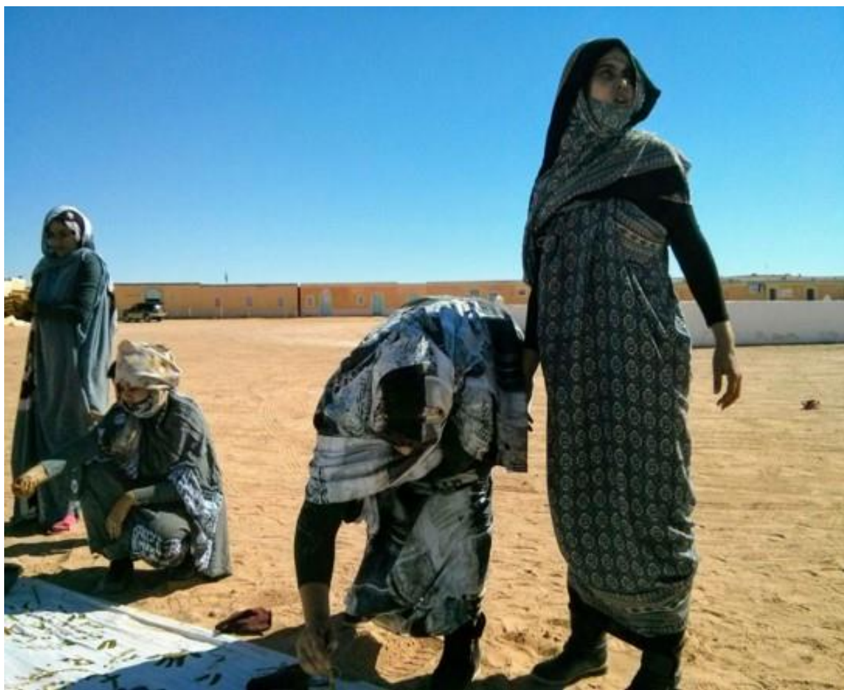
Figura 3. Mujeres saharauis mapeando con henna en la Wilaya Bojador (campamento de personas refugiadas en Tindouf, Argelia. Octubre de 2017).

En ocasiones, las crisis y las guerras se convierten en “una fuente de empoderamiento que les permite desarrollar otras actividades diferentes a las que tradicionalmente le son asignadas en la sociedad, relacionadas con el desempeño de un rol meramente reproductivo” (GRANDE y RUIZ, 2016, p.186). A esto y más es a lo que se han enfrentado las mujeres saharauis, quienes “a lo largo de los años, en el exilio, en la hammada argelina y en la vida bajo ocupación marroquí han desarrollado experiencias y estrategias de resistencia diversificando y ampliando sus posibilidades de agencia” (BRACCO, 2018, p.1).