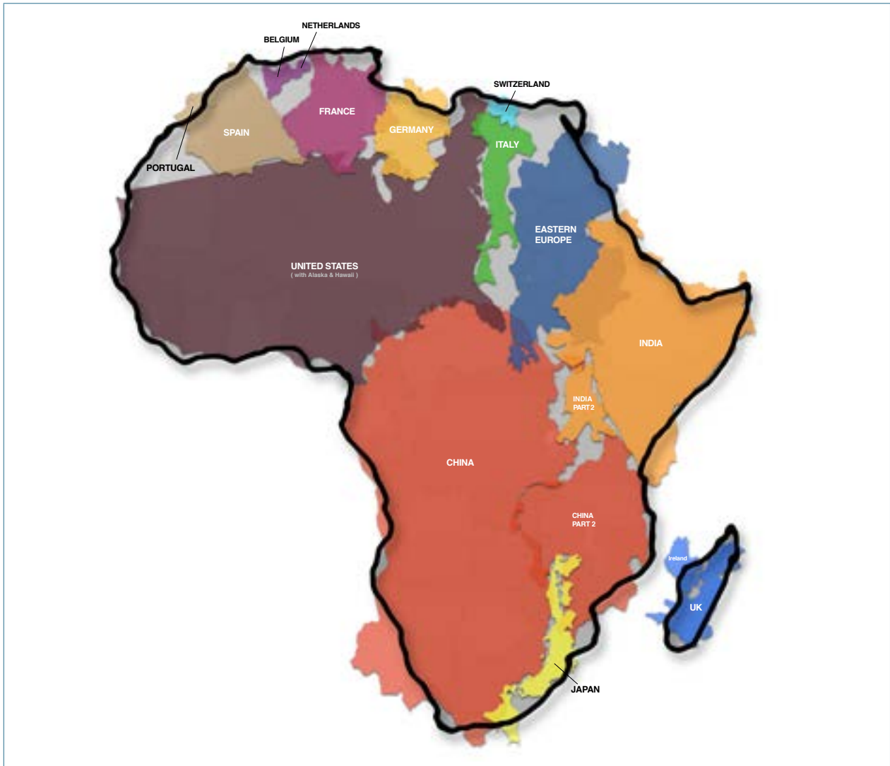
2. irudia. Afrikar kontinentearen munduaren gainerako lurraldeekiko ikuspegi distorsionatuari buruzko mapa kritikoa. Iturria: Kai Krause "The True Size of Africa".