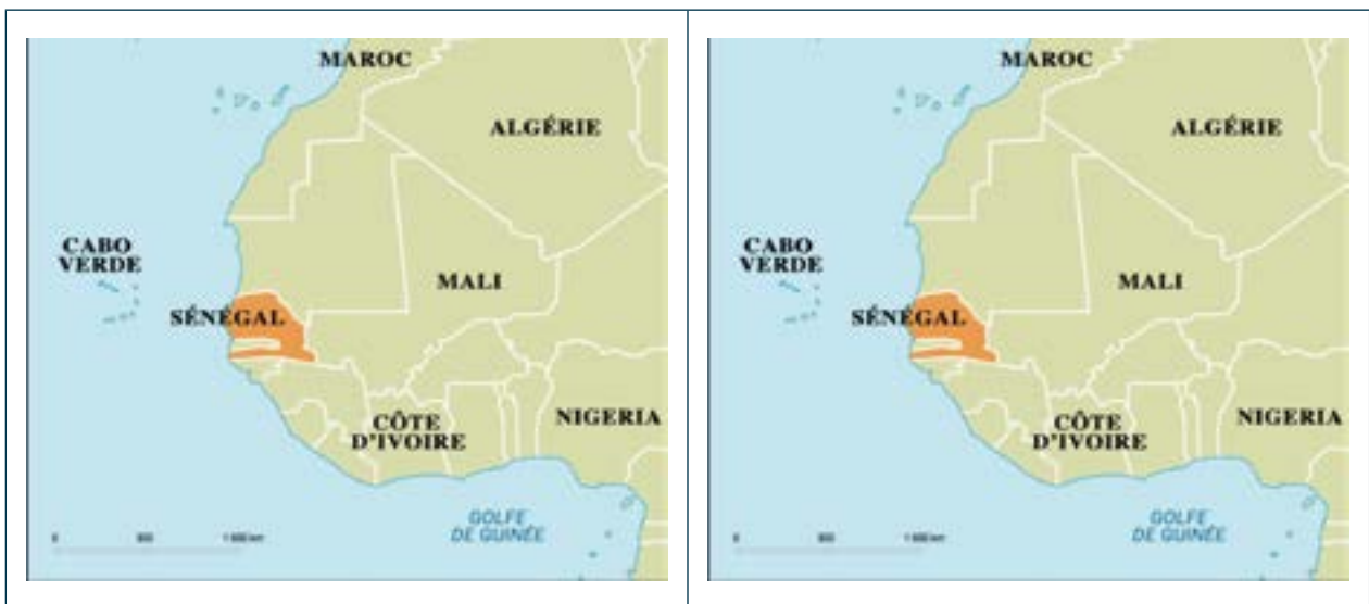
3. irudia. Senegalek Afrikan duen eta Saint Louisek Senegalen duen kokapenaren mapak.