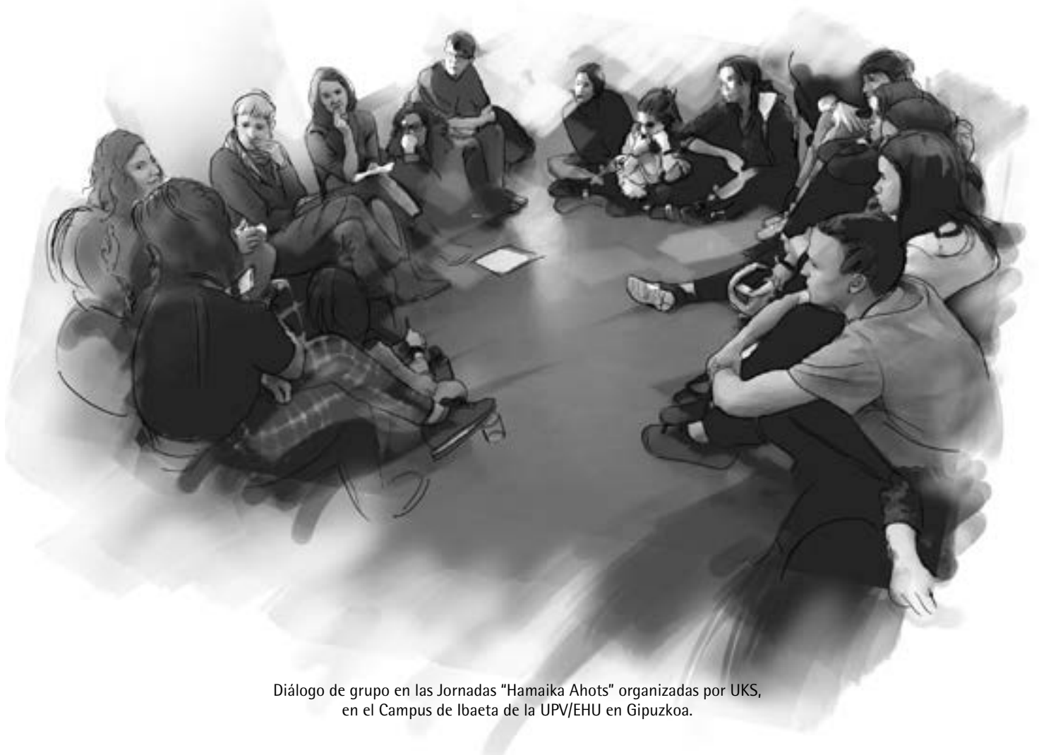
Diálogo de grupo en las Jornadas "Hamaika Ahots" organizadas por UKS, en el Campus de Ibaeta de la UPV/EHU en Gipuzkoa.