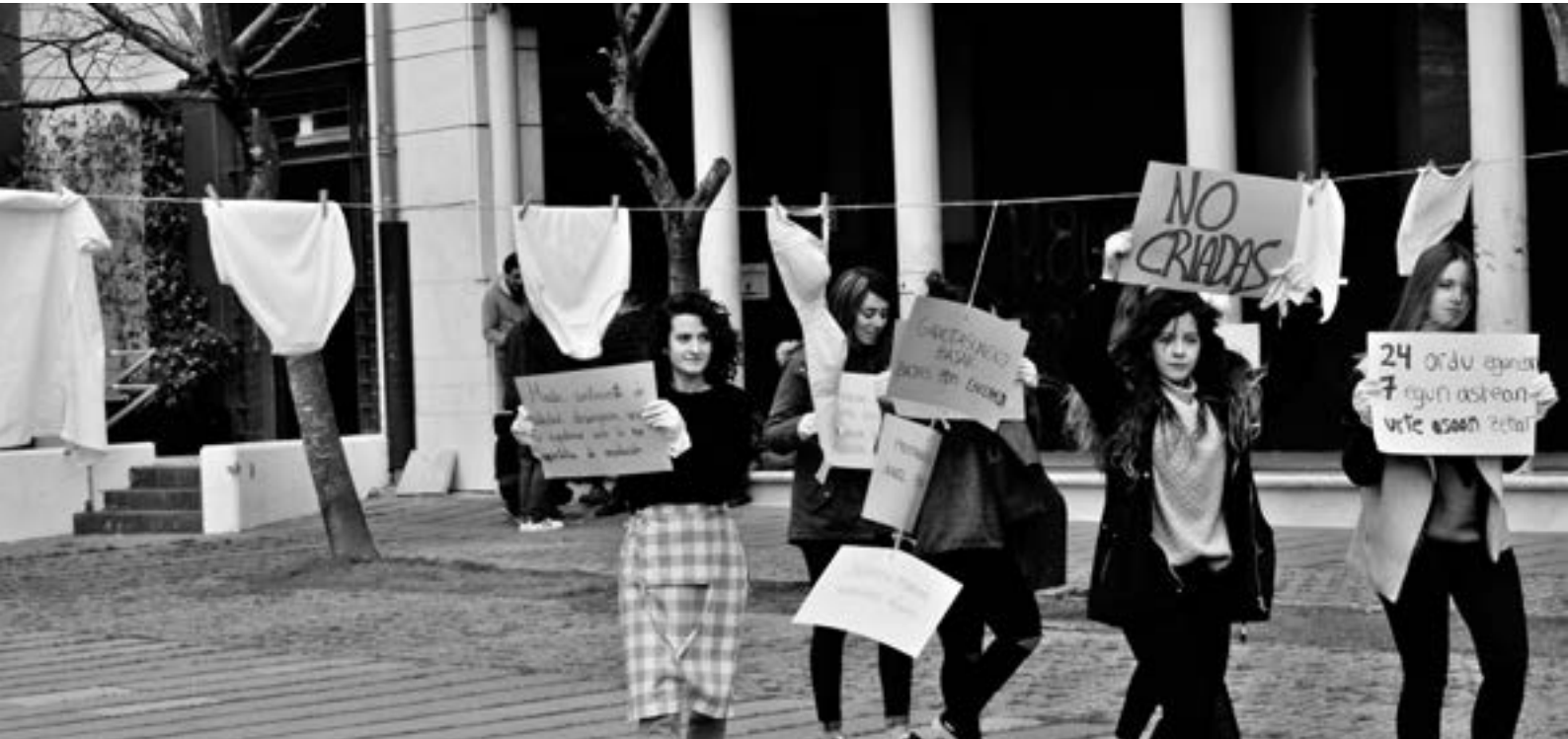
(Acción estudiantil contra la explotación laboral de las trabajadoras del hogar, en el Campus de Ibaeta de la UPV/EHU en Gipuzkoa).

sadas en tanto clientes/consumidoras (ver Manzano-Arrondo, 2011).