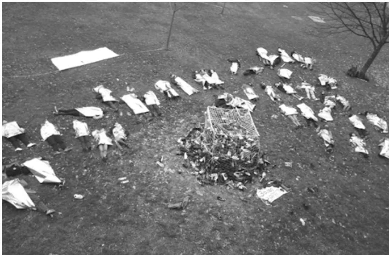
(Acción de SOS Racismo, Emaús y UKS contra las políticas racistas de Europa, en el Campus de Ibaeta de la UPV/EHU en Gipuzkoa).

(o no) el contacto y la participación. Creemos que es fundamental, desde una perspectiva ecológica del saber, una actividad docente e investigadora en la cual el conocimiento circule y los espacios de construcción del saber entren y salgan del espacio universitario. De esta manera, los saberes del tejido asociativo estarían mucho más presentes en las aulas, pero también la transferencia del conocimiento académico a la sociedad sería un valor fundamental de la práctica universitaria.