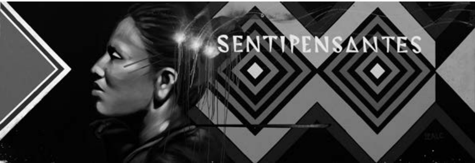
(Mural "Sentipensantes" del artista plástico colombiano Oscar González "Guache", en la Facultad de Ciencias Sociales de la Universidad de Buenos Aires, Argentina).

“ Los/as universitarios/as, como grupo cultural privilegiado de las sociedades, pueden construir un anticonformismo científico en pos del cambio social ”