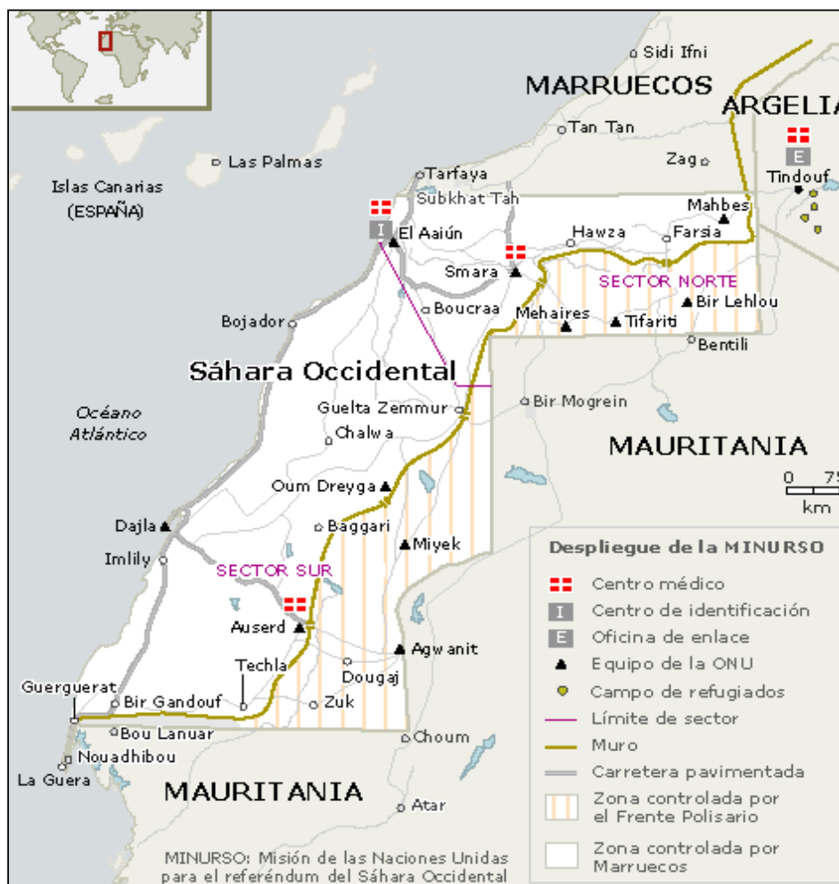
FIGURA 1: MAPA DE LA REGIÓN. EL TERRITORIO DEL SÁHARA OCCIDENTAL

muro (75% del total aproximadamente) está controlado por Marruecos y al este por el Frente Polisario (véase figura 1). Las ciudades, infraestructuras y recursos (los bancos de pesca, las minas de fosfato y los posibles yacimientos de petróleo y gas natural) se encuentran al oeste del muro y, por lo tanto, bajo supervisión y control marroquí 13 . En la zona bajo control del Frente Polisario se encuentra población, principalmente nómada, que se desplaza con el ganado desde los Campamentos de refugiados durante largas temporadas. La agrupación mayor está en Tifariti.