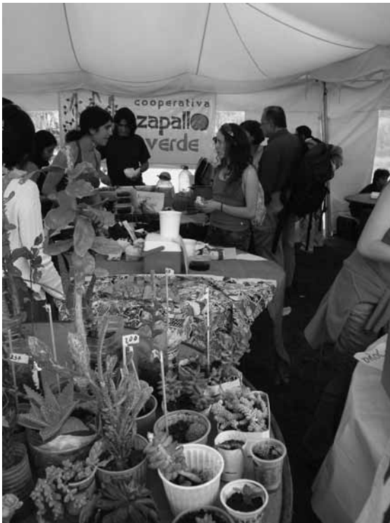
Feria campesina, Ecuador