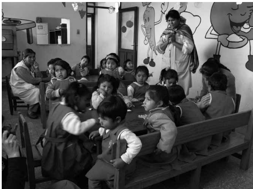
Aula infantil instituto Tupak Katari, Sucre, Bolivia

A diferencia de los países industriales, donde existen experiencias ciudadanas en las periferias urbanas y semi-urbanas, o bien ejecutadas por actores neo-rurales (habitantes urbanos que retornan al campo), en la América Latina la mayor parte de las iniciativas encaminadas a construir el poder social es representado por sus poblaciones rurales campesinas e indígenas. Ello, en parte, se explica por la enorme presencia de la población campesina (unos 65 millones) y el gran número de habitantes indígenas (40 a 55 millones), pertenecientes a unas 800 culturas, que en el caso de varios países conforman conglomerados sociales dominantes (Guatemala, Perú, Bolivia, Ecuador), o son propietarios de enormes territorios. Esto último es el caso de Colombia, donde la