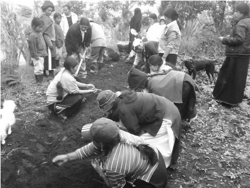
Formación en cultivos ecológicos, Cotacachi, Ecuador

exclusivo de la periferia sino que se encuentra (y a veces con mayor intensidad) en los países centrales.