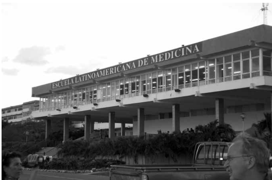
Escuela Latinoamericana de Medicina, La Habana

Escobar y otros autores de la corriente conocida como post desarrollo han argumentado que estas características están siempre presentes en el discurso del desarrollo, con independencia de si se trata de teorías dominantes o alternativas y han convocado a pensar alternativas AL desarrollo. Mientras éste es de carácter normativo imponiendo a las personas y a las sociedades una forma de percibirse a sí mismas, de interpretar sus vidas y de proyectarse hacia el futuro, el post desarrollo ofrece argumentos que cuestionan la universalidad del modelo y convocan a identificar y promover “otras maneras de hacer las cosas”. El desarrollo