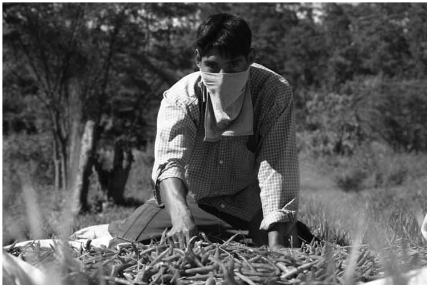
Producción de frijoles en comunidades zapatistas de Chiapas

* En círculos académicos se examina por primera vez con seriedad la tesis que hace 20 años sostiene Imanuel Wallerstein de que nos encontramos en la fase final del capitalismo como régimen de producción. Algunos analistas sostienen que no terminaría por sus contradicciones estructurales, las que examinó Marx y Wallerstein retoma, sino por una especie de suicidio, provocado por los fundamentalistas de mercado. Las advertencias de Soros habrían resultado válidas.