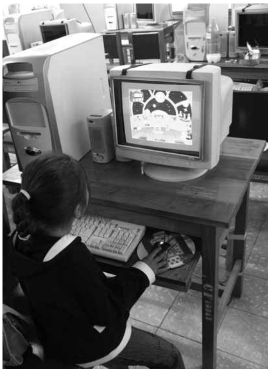
Clase de informática en el instituto Tupak Katari, Sucre, Bolivia

La movilización de las ciudadanías y sus organizaciones (asambleas de barrios, comunidades, cooperativas, grupos gremiales, organismos de gestión, etc.) alcanza su forma de poder social, cuando se salta de la protesta o la mera resistencia al control efectivo de espacios: barrios de ciudades, comunidades, municipios, cuencas, regiones. Cinco criterios permiten visualizar una plataforma mínima para la construcción del poder civil o ciudadano: