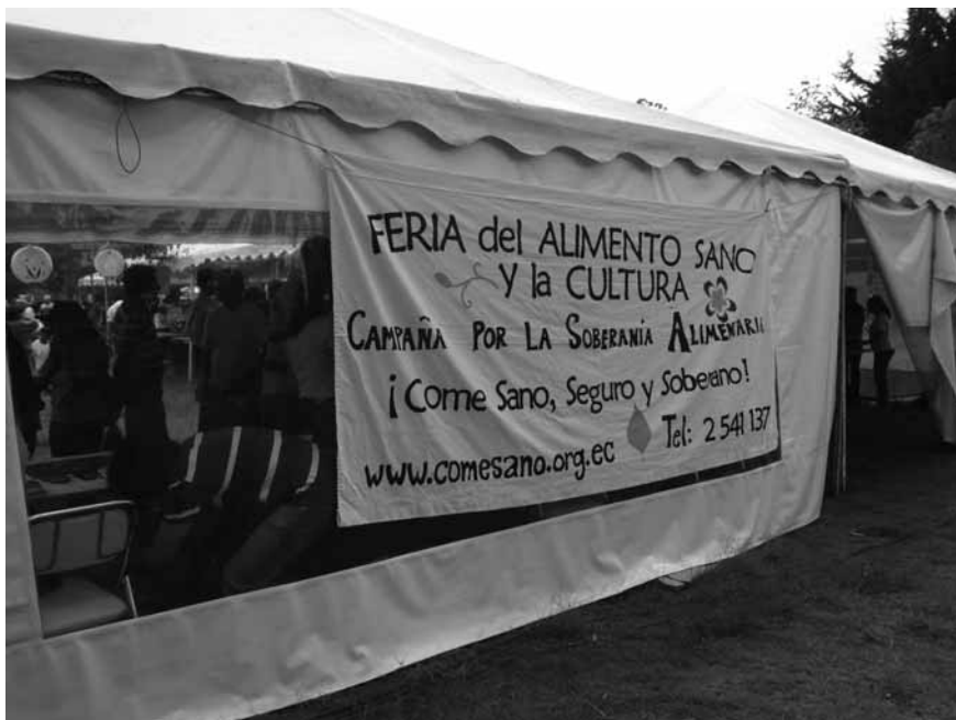
Feria campesina, Ecuador

y no de desarrollo (Pereira, 2009). Hasta mediados de los años cincuenta, la cartera de inversiones del Banco Mundial fue básicamente destinada a la reconstrucción de Europa y poco o nada a las "áreas subdesarrolladas" (Truman). Fue la ola descolonizadora desencadenada por los pueblos africanos y asiáticos en la post guerra, la que proporcionó las condiciones para que los países que perdían sus colonias reinventen esa noción colonial, que pasó a dividir el mundo entre los que eran desarrollados y los subdesarrollados, estableciendo que estos deberían seguir el modelo de aquellos. A partir de entonces, las agencias (poco) multilaterales se encargaron de contratar científicos y técnicos para medir cuanto faltaba a los sub para que se vuelvan desarrollados y, para eso, diversas