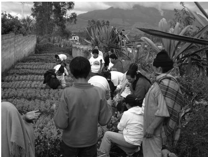
Formación en cultivos ecológicos, Cotacachi, Ecuador

Para toda una generación, la mía, el desarrollo fue sagrado e inviolable. Era el ídolo común de sectas que perseguían la misma meta por medios incompatibles. Pero ha llegado el momento de reconocer que es el propio desarrollo el mito maligno que amenaza la supervivencia de las mayorías sociales y de la vida en el planeta. Necesitamos oponernos con firmeza a la esperanza adicional de vida que se quiere dar al desarrollo con la creación de alternativas. Padecemos ya las consecuencias de adjetivos cosméticos, que trataban de disimular el horror: desarrollo social, integral, endógeno, centrado en el hombre, sustentable, humano, "otro"... No podemos esperar que la salida provenga de burócratas de las instituciones internacionales ni de los nuevos cruzados del "desarrollo alternativo", que derivan dignidad e ingresos de la promoción del desarrollo. Las cuatro décadas del desarrollo fueron un experimento gigantesco e irresponsable que, según la experiencia de las mayorías de todo el mundo, ha fracasado miserablemente. La crisis actual es la oportunidad de desmontar la meta del desarrollo en todas sus formas.