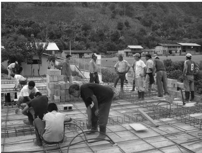
Construcción centro salud, Cotacachi, Ecuador

2) NDLT: En portugués, “desenvolvimento” significa desarrollo, mientras que “envolvimento” significa envoltura, involucramiento o enredo. Por la connotación que le da el autor a los términos, mantenemos ambas palabras en dicho idioma.