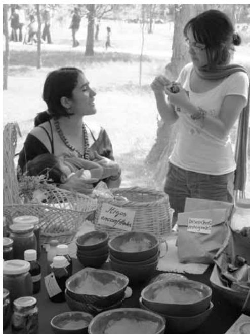
Feria campesina, Ecuador

devenir en un pluriverso de configuraciones socio-naturales (multiplicidad de visiones, tales como liberales y comunales, capitalistas y no capitalistas, etc.); d) propender por formas de integración regional autónomas en base a criterios ecológicos y de desarrollo autocentrado (no dictado por los requerimientos de la acumulación mundial de capital), a niveles subnacionales, nacionales, regionales, y globales.