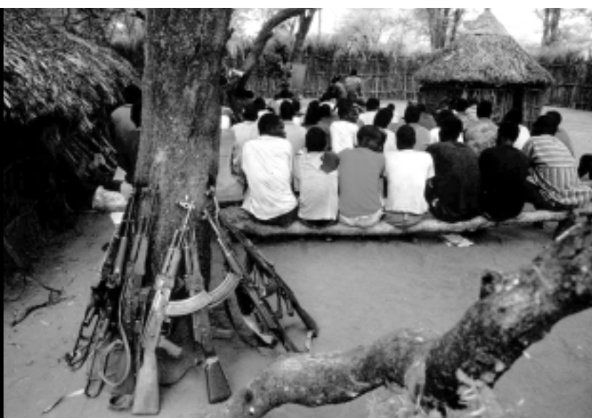
Guerrilleros sudaneses recibiendo clase. Narus (Sudán), marzo de 1995

Todos ellos merecen protección ante las amenazas, y tienen derecho a una vida segura, libres de violencia y sin explotación laboral ni sexual. Tienen derecho, en definitiva, a vivir en sus comunidades con garantías de acceso a los sistemas de sanidad y educación y con garantías de empleo. Los antiguos menores-soldado han de tener asistencia y oportunidades para reconstruir sus vidas, especialmente las niñas soldado, quienes requieren una asistencia adicional para protegerse de los abusos y de otras formas de violencia sexual.