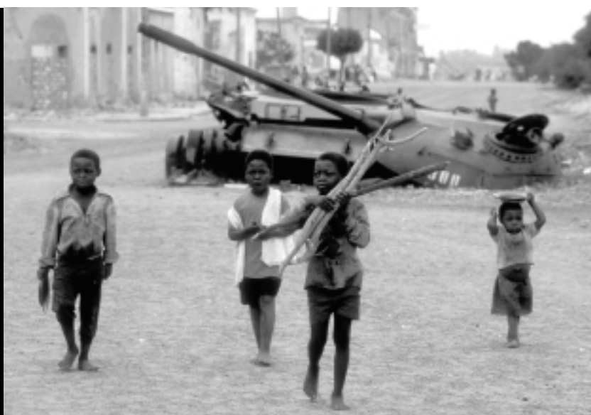
Grupo de niños en Kuito (Angola), septiembre de 1995

7º. Menores obligados a huir. La mitad de las personas desplazadas en todo el mundo son menores. Es necesario aumentar el compromiso internacional a favor del cuidado y protección de los menores refugiados o desplazados debido al alarmante abandono en que se encuentran las personas desplazadas, especialmente los menores y las mujeres. Los niños y niñas desplazados nunca recibirán la protección y cuidados adecuados si no se aumenta significativamente el apoyo financiero y político y se mejoran los acuerdos institucionales.