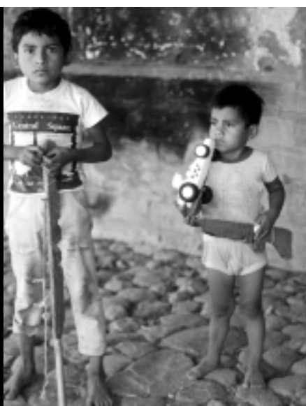
Dos niños juegan con armas de madera en una zona de fuertes combates. San José las Flores (El Salvador), marzo de 1989

En definitiva, los programas de DDR para menores-soldado se tendrían que alejar de la lógica que caracteriza las medidas diseñadas para los antiguos combatientes adultos y deberían centrarse en un aspecto mucho más social y psicológico. Al contrario de lo que se ha venido llevando a cabo hasta el momento, los procesos de DDR para menores se deben entender como un valor agregado de futuro para el desarrollo de la sociedad en el marco de la rehabilitación posbélica. Esta tarea depende, en buena medida, de la voluntad política y de la captación de recursos económicos.