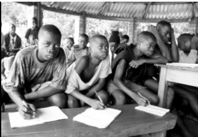
Niños-soldado en un centro de rehabilitación. Hamilton (Sierra Leona), diciembre de 2000