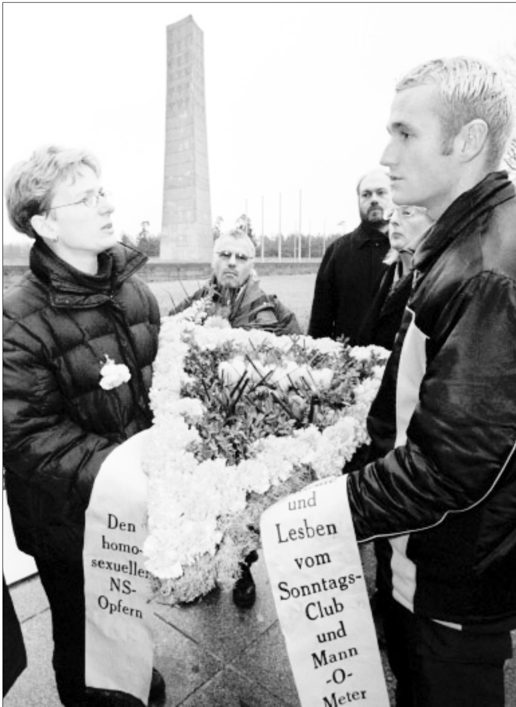
Una corona en forma de triángulo rosa, el símbolo que las autoridades nazis obligaban a llevar a los homosexuales, en memoria de los homosexuales fallecidos en el antiguo campo de concentración de Sachsenhausen, Alemania. La corona se colocó en 1999. © Fabrizio Bensch/Reuters 1999