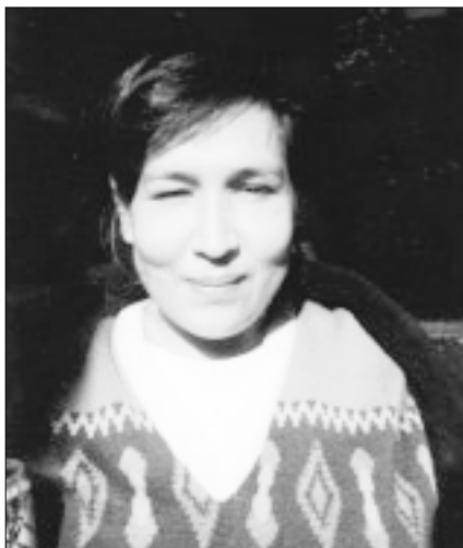
Lohana Berkins, activista de los derechos de los transexuales, Argentina.