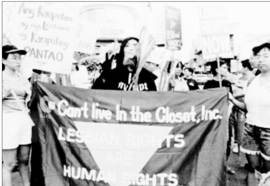
Un grupo de lesbianas participan en la primera marcha de gays y lesbianas celebrada en Filipinas, en junio de 1996.

cumplimiento del Pacto Internacional de Derechos Civiles y Políticos por los Estados Partes. En 1994, el Comité declaró que la ley conculcaba su derecho a la vida privada, además del derecho a no ser discriminado. El Comité observó que la referencia al «sexo» en las cláusulas sobre no discriminación del Pacto —artículos 2.1 y 26— debía interpretarse en el sentido de incluir la «inclinación sexual», afirmando así que no se pueden negar los derechos que protege el Pacto Internacional de Derechos Civiles y Políticos a ninguna persona debido a su orientación sexual. 15 Otros órganos de vigilancia de la ONU han subrayado también que las normas jurídicas internacionales prohíben la discriminación basada en la orientación sexual. 16 Además, el Tribunal Europeo de Derechos Humanos ha declarado que prohibir