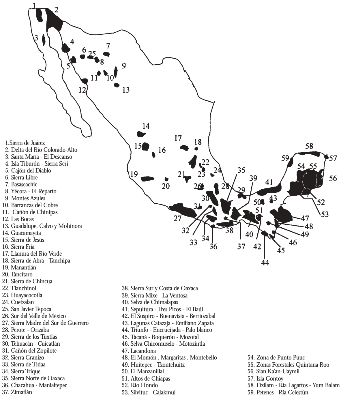
Figura 1. Áreas prioritarias para la conservación de la biodiversidad de México recomendadas por la CONABIO (Comisión Nacional para la Conservación y el Uso de la Biodiversidad), que se traslapan con territorios de población indígena (comunidades y ejidos).