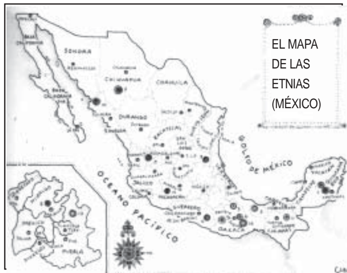
1. Maya - 2. Maya - 3. Mixe - 4. Tlapanec - 5. Popoluca - 6. Mixtec - 7. Tarahumara - 8. Otomi - 9. Huastec - 10. Mayo - 11. Tzeltal - 12. Nahuatl - 13. Purépecha - 14. Mazatec - 15. Huichol - 16. Zapotec