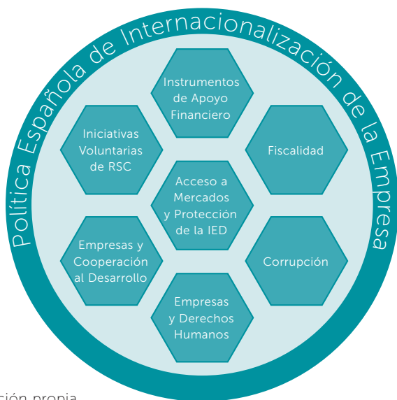
Figura 1. Mosaico de ámbitos que configuran la política española de internacionalización de la empresa

Esta peculiar composición de la política de internacionalización de la empresa contribuye a que, con frecuencia, los actores públicos españoles responsables de las distintas piezas del mosaico actúen de forma descoordinada y con mandatos y objetivos no alineados o incluso contradictorios entre sí. Esta fragmentación tiene implicaciones para el grado de coherencia con el que España ejecuta esta política y es una de las causas que serán analizadas en esta publicación para explicar por qué los criterios y compromisos sociales, medioambientales y de derechos humanos asumidos por España no son tenidos necesariamente en cuenta en el diseño e implementación de esta política o son considerados como objetivos subsidiarios.