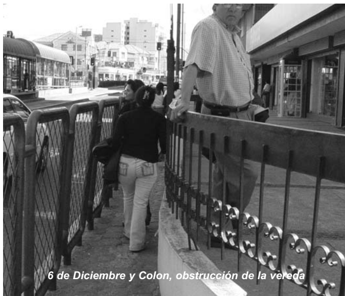
6 de Diciembre y Colon, obstrucción de la vereda

Las obstrucciones para la circulación peatonal también son causadas por los diseños municipales: muchas de las casetas de ventas, kioscos, se encuentran bloqueando la circulación peatonal, los cerramientos en las veredas para evitar los cruces en las esquinas también se convierten en sitios inseguros e incómodos para el libre tránsito de las personas, igual sucede con las paradas de buses acompañadas de rótulos de propaganda, los postes eléctricos, cámaras transformadoras de energía, entre otros elementos de equipamiento urbano.