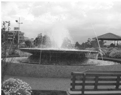
Parque lineal Machángara

Se refiere a la infraestructura y elementos tangibles. Debe contar con una fácil accesibilidad e iluminación. El diseño (tamaño, coherencia, ubicación) y la materialidad (elementos como árboles, asientos, faroles, ágoras, juegos infantiles, basureros) otorgan sentido y significado a los espacios, condicionan su uso y enriquecen el patrimonio arquitectónico y social de los barrios. Su diseño debe ir en correspondencia con los requisitos de las personas para un adecuado desarrollo de su vida social, ya que los espacios físicos no garantizan su uso de por sí.