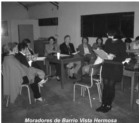
Moradores de Barrio Vista Hermosa

Por ello, las acciones en las que se busque la integración a la comunidad deben incluir la participación de estos “grandes” actores. Los niños son alejados cada vez más de los espacios donde pueden conocer otras personas y compartir juegos, espacios, sueños, imaginación. Si los parques son apropiados se convierten en espacios seguros donde los niños pueden aprender mucho más mediante la interrelación con otros como ellos.