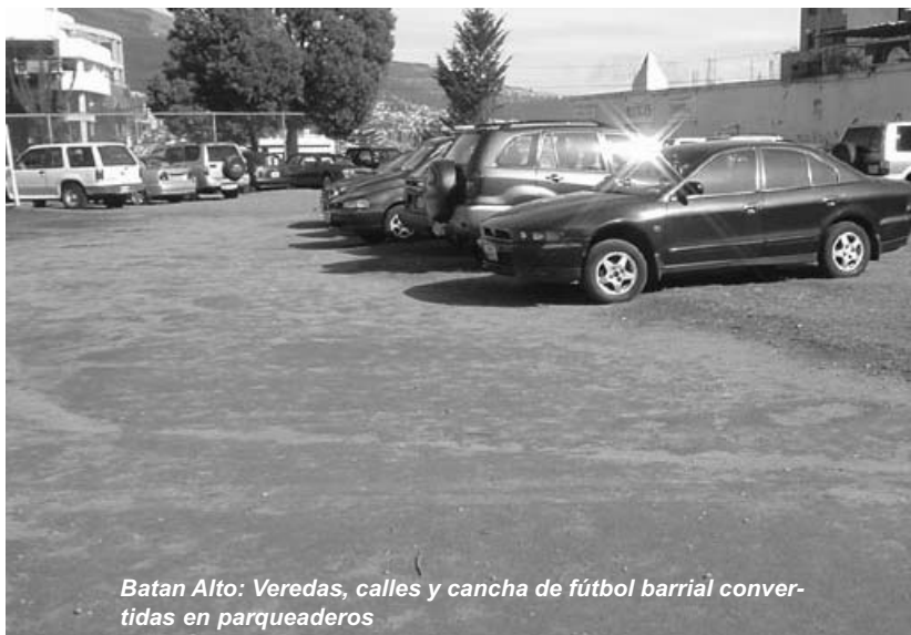
Batán Alto: Veredas, calles y cancha de fútbol barrial convertidas en parqueaderos

Para un ancho de vereda, la ordenanza sugiere un mínimo de 1.20 metros, mientras que los estudios internacionales señalan la necesidad de que las veredas tengan al menos 2.00 metros; en cuanto a los pasos peatonales y cruces cebra, su ubicación debe favorecer al peatón y no a los autos, pues no sirve de mucho tener puentes peatonales que son de difícil acceso que nos son utilizados por los transeúntes. Además, los pasos cebra no deben hallarse obstruidos con mallas, barandas, vallas, etc.; otro aspecto a considerar que debe reforzarse en la ordenanza es la obligatoriedad de realizar obras en las que se facilite el acceso a las personas con alguna discapacidad, pues si bien la ciudad ha avanzado en estos aspectos, aún le falta mucho para llegar a estándares internacionales.