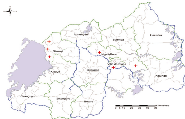
FIG 2: + Distritos en los cuales se desarrolló la evaluación de los microcréditos para actividades agro-ganaderas.

A comienzos del año 2004, la Cruz Roja Ruandesa y la Cruz Roja Española deciden que ha llegado el momento de realizar una evaluación en profundidad de sus intervenciones.