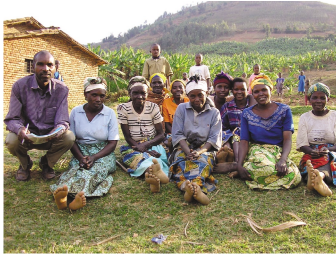
FIG 4: Asociación de Mujeres Beneficiarias

Los testimonios recogidos por el equipo evaluador indican una mejora en el nivel de vida de los beneficiarios que se explicita principalmente a través de varios tipos de manifestaciones.