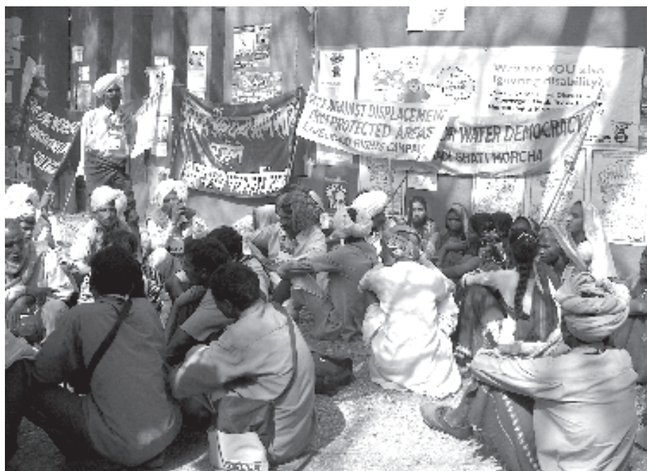
Manifestación en contra de la privatización del agua.

de una gran parte de la humanidad si no se toman urgentemente medidas de racionalización y preservación. 8