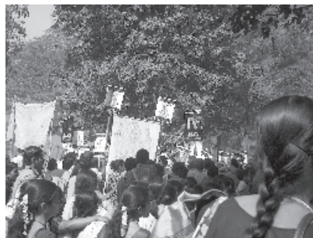
Manifestación contra la Coca-Cola.

Los problemas del agua no pueden tratarse aisladamente, deben ser integrados en los esquemas de desarrollo económico