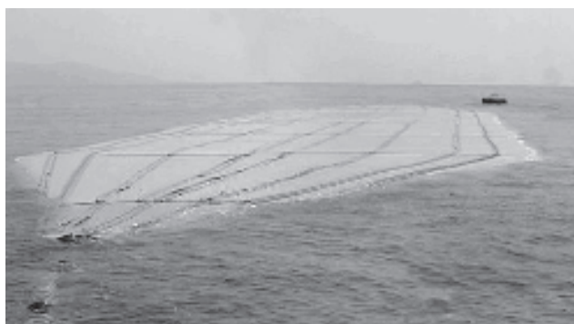
Balón que arrastra 35.000 toneladas de agua dulce por el mar.

El agua se ha convertido en oro azul. Comprar los derechos del agua y privatizar los sistemas públicos, promover el agua embotellada, vender y trasladar el agua de zonas húmedas ricas a zonas pobres sedientas está a la orden del día en los cinco continentes.