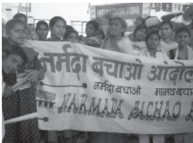
Manifestación contra el embalse de Narmada.

de la gasolina que oscila entre 21 y 25 tk. Ahora empiezan a haber también dudas sobre el agua embotellada, después de comprobarse que gran parte de las marcas comercializan sencillamente agua de la red que ni tan sólo ha sido hervida y con muchas bacterias coliformes, cuestionándose la salud de centenares de miles de personas». 17 La mayor parte de la población de Bangladesh es pobre, el 61% está por debajo de los umbrales de pobreza absoluta según el Banco de desarrollo asiático y la comisión gubernamental y el 40% restante esta en situación de pobreza relativa, así es que no pueden comprar agua potable. Millones de personas de áreas rurales utilizan bombas manuales o pozos superficiales. Cerca del 95% de los pocos que tienen acceso al agua de red, supuestamente segura está siendo afectada por arsénico «el envenenamiento más grande que ha sufrido una población en la historia por haberse contaminado las reservas de agua subterráneas con arsénico inorgánico». Entre 33 y 77 millones de personas de una población de 125 millones tienen están en situación de riesgo mortal por envenenamiento por arsénico. El 80% de los pozos, según el departamento de salud pública, está contaminado, tanto los más superficiales de 20m como los de 80 y 100m. El agua superficial de los ríos tampoco es segura. La compra de agua es el gasto más importante de muchas familias. El Departamento de emergencia nacional ha declarado el agua de Bangladesh como no apta para el consumo. Es urgente buscar fuen-