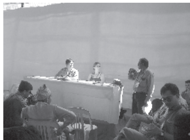
Public Citizen, «defendiendo los bienes comunales globales».

los recursos naturales de la Tierra sin importar su localización geográfica. En cuanto al agua en particular, la geopolítica de los recursos naturales permite comprender la operación de la banca multinacional y las transnacionales del sector con el objetivo de manejar este recurso».