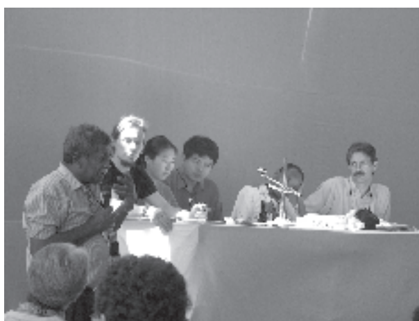
Miembros del Corporate Europe Observatory de los Países Bajos.

La conservación es la forma para resolver la crisis del agua. Y esta conservación sólo puede mantenerse con la movilización de los pueblos, comunidades y en especial de la población rural, ellos son los que deben tomar el control sobre el agua.